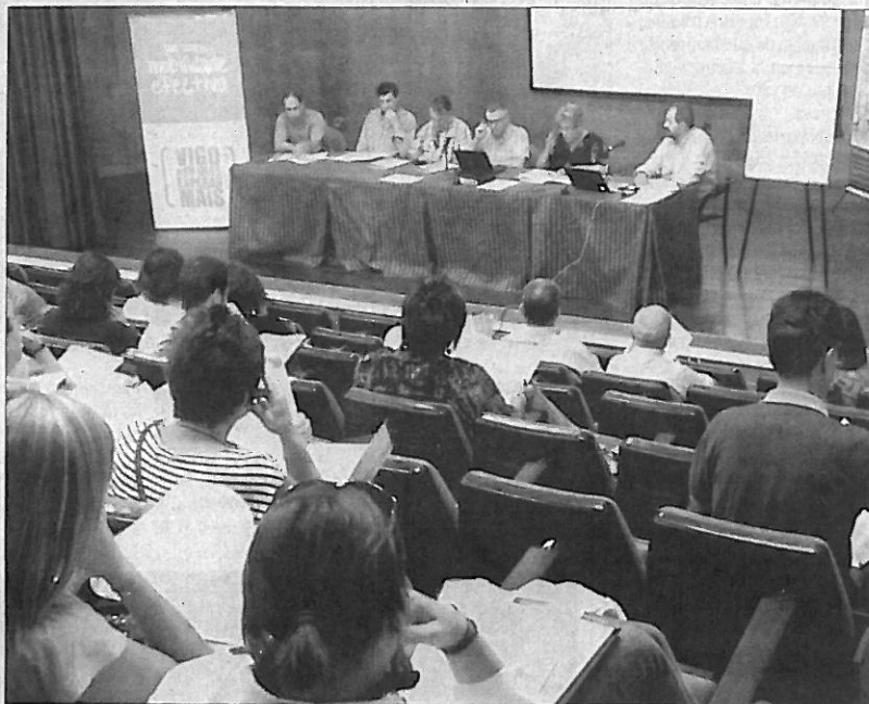
La Federación de Vecinos aprobó ayer en asamblea poner en marcha una campaña "por una movilidad efectiva".

La federación pide que "se haga partícipe a los vecinos" en la elaboración del Plan de Inversión Local para 2010, que se convoque el consejo municipal de transportes trimestralmente y el consejo municipal de movilidad.