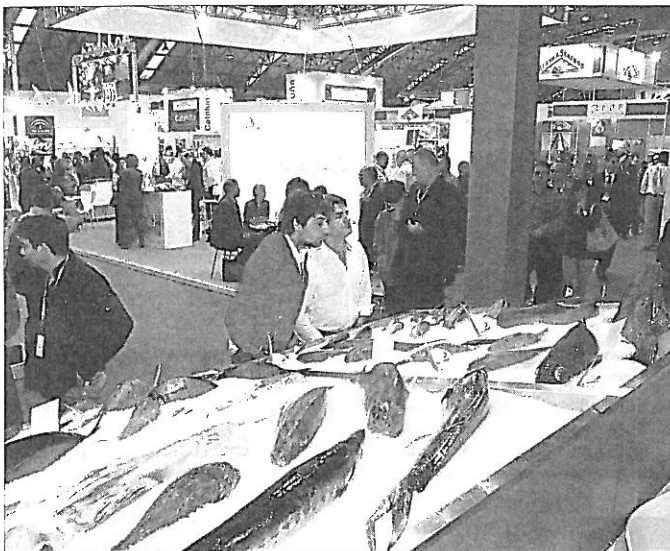
Conxemar cerró sus puertas tras tres días de intensa actividad económica, aunque también hubo tiempo para exhibiciones (derecha).

Para conseguirlo creen imprescindible que se revisen los trazados, se pongan en marcha nodos intercambiadores y un abono metropolitano, además de otro para no residentes y turistas. También creen necesario potenciar transportes alternativos, como la bicicleta, y que se lance el servicio de transporte metropolitano.